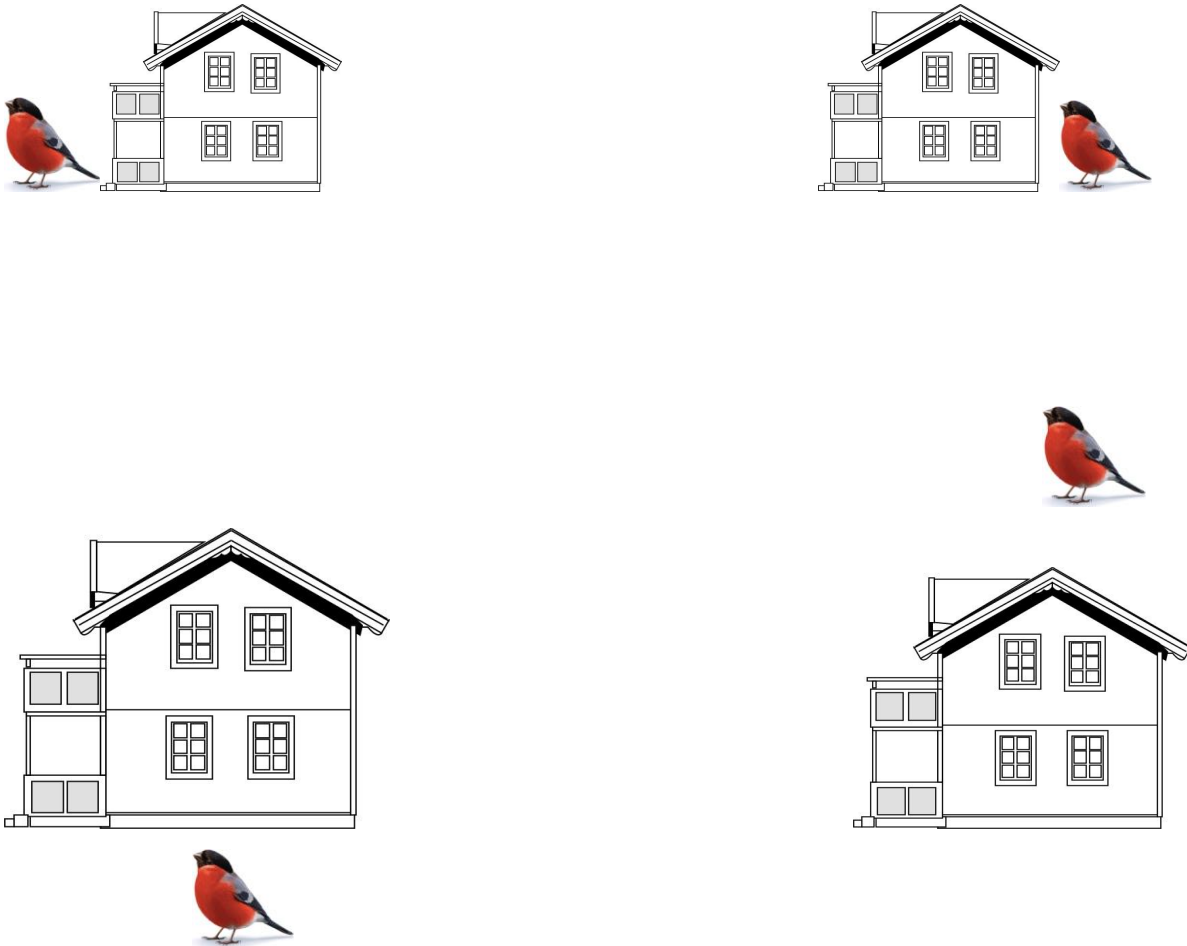
Рис. 1 а.