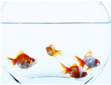
Рис. 1 б.