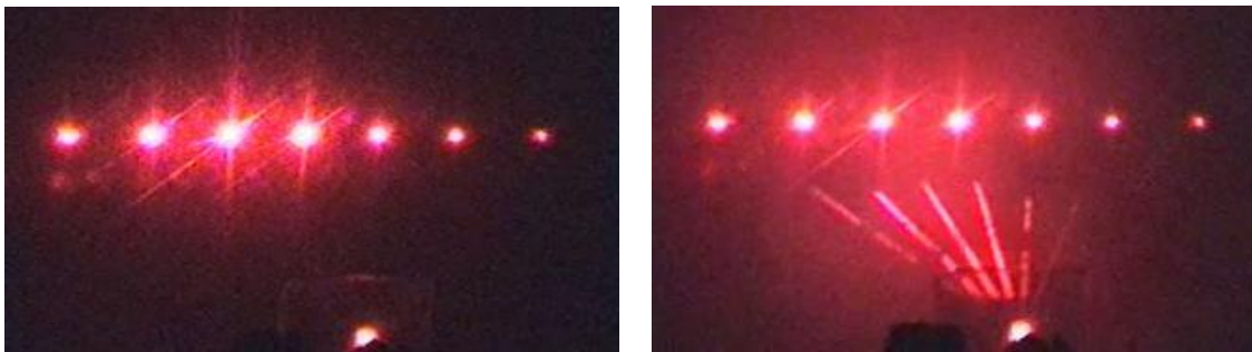
Рисунок 8. Дифракция на решетке с использованием задымления.

Дифракция на решетке (рис. 8). Если вместо отверстия использовать систему прозрачных параллельных полос на прозрачном стекле, то вид дифракционной картины изменится: появится серия дифракционных максимумов, укладывающихся на линии. Использование дыма позволяет проявить распространение луча.